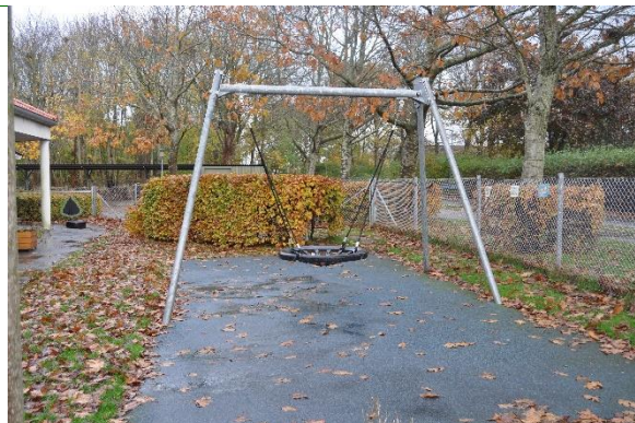
Redskab: Gyngesæde Årgang: 2020 Producent: Kompan Er redskabet mærket: Ja Emne 8: Er der registreret fejl / mangler: Nej