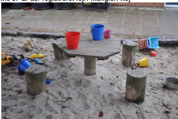
Redskab: Sandbord m. stole

Emne 4: Er der registreret fejl / mangler: Ja