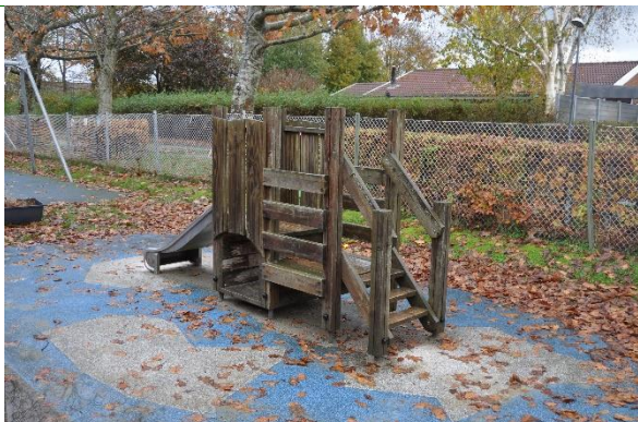
Redskab: Klatreredskab m. rutsjebane Årgang: Producent: Uniqa Er redskabet mærket: Ja Emne 7: Er der registreret fejl / mangler: Nej