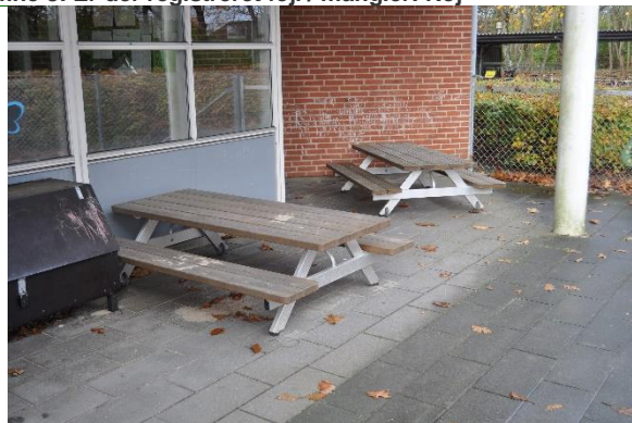
Redskab: Bordbænke Ikke omfattet af DS/EN 1176 Emne 10: