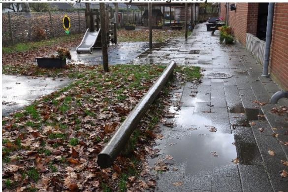
Redskab: Balancebom Årgang: 2008 Producent: Egen produktion Er redskabet mærket: Ja Emne 9: Er der registreret fejl / mangler: Nej